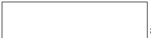
Схема границы эксплуатационной ответственности

е) локальные очистные сооружения на объекте _____ (есть/нет).